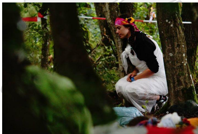
Simpatična prebivalka planeta Zomfshark.

Dogajanje na taboru je pestro, saj voditelji pripravljajo veliko dejavnosti, ki jih na zanimiv način izvedejo. Naš tabor je razdeljen na pet podtaborov, v katerih je enajst čet iz jugovzhodne slovenske regije. Na tem taboru moram pohvaliti medicinsko oskrbo, ki je zelo dobro usposobljena in kar najhitreje ukrepa, kar pa se tiče hrane - zajtrki so podobni kot na prejšnjih taborih, kosila imajo zraven še sladico, večerje pa so zaenkrat večinoma enolončnice. Kdo je to napisal? En fant iz Šentjerneja z zlomljeno roko