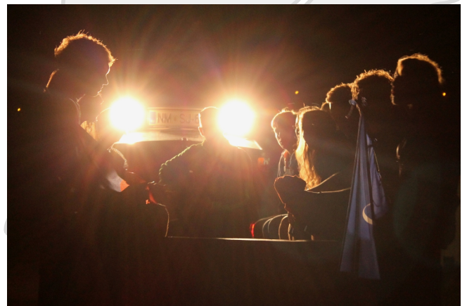
Vožnja s traktorjem.